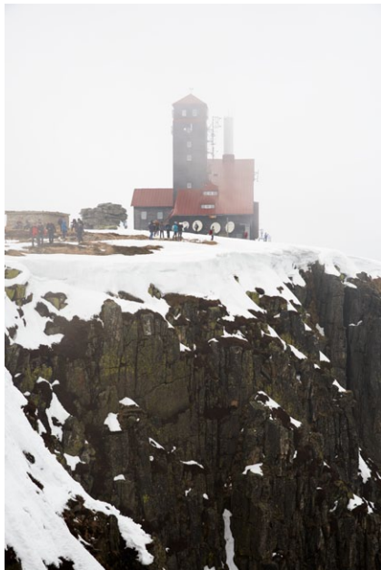
Radio-Telewizyjny Ośrodek Nadarwczy Śnieżne Kotły fot. Waldemar Kubiak; 2016