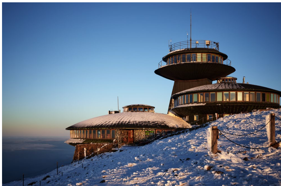
Wysokogórskie obserwatorium meteorologiczne im. Tadeusza Hołdysa na Śnieżce 2021

Dużą i jednocześnie bardzo znaną część mezoregionu zajmuje pasmo górskie Karkonoszy. Nieumiarkowana eksploatacja obszaru górskiego przez człowieka — kilkuwiekowa działalność związana z pasterstwem i hodowlą bydła, masowa dewastacja drzewostanu, łowiectwo, zielarstwo przeprowadzane na szeroką skalę, a także moda na kolekcjonowanie roślin i owadów oraz rozwój turystyki masowej spowodowały ogromne szkody w karkonoskim ekosystemie. Pomimo wcześniejszych inicjatyw związanych z ochroną przyrody, dopiero w styczniu 1959 roku został utworzony Karkonoski Park