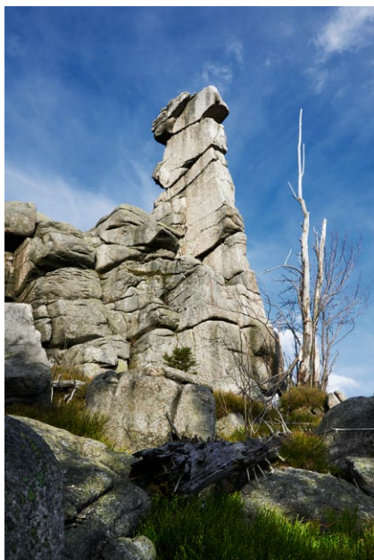
Owcze Skąły fot. Waldemar Kubiak; 2016