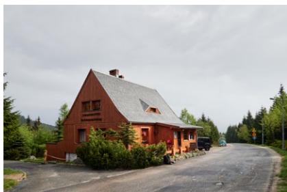
Schronisko PTTK „Na Przełęczy Okraj” 2016

Dużą i jednocześnie bardzo znaną część mezoregionu zajmuje pasmo górskie Karkonoszy. Nieumiarkowana eksploatacja obszaru górskiego przez człowieka — kilkuwiekowa działalność związana z pasterstwem i hodowlą bydła, masowa dewastacja drzewostanu, łowiectwo, zielarstwo przeprowadzane na szeroką skalę, a także moda na kolekcjonowanie roślin i owadów oraz rozwój turystyki masowej spowodowały ogromne szkody w karkonoskim ekosystemie. Pomimo wcześniejszych inicjatyw związanych z ochroną przyrody, dopiero w styczniu 1959 roku został utworzony Karkonoski Park