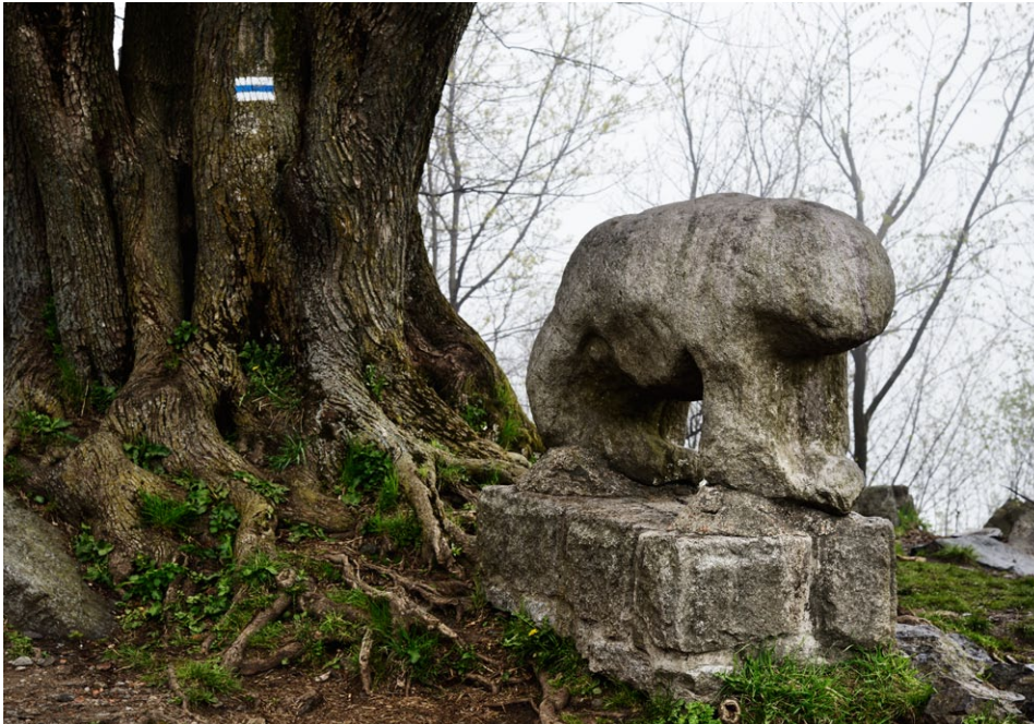
Starożytna rzeźba kamienna Niedźwiedź, polana podszczytowa, Śląza fot. Waldemar Kubiak; 2015

źródłkami (Święte Źródło, Klasztorne, Kacza Kałuża czy Źródło Życia), kamiennymi rzeźbami (Niedźwiedź, Postać z rybą, Mnich, Grzyb), kręgami kultowymi czy duchami bożych bojowników przemkających przy relikwach ślązańskiego zamku. Znaczący architektury i sztuki sakralnej mogą podziwiać sobótczańskie świątynie, kościoły na Ślązy bądź sanktuarium w Sulistrowiczkach. W masywie znajdują się również wieże widokowe. Najbardziej znaną jest dwunastometrowa konstrukcja na szczycie Ślązy. Wytrwali fani mogą dotrzeć do dwóch tzw. wież Bismarcka — na Wieżycy (1907) i na Jańskiej Górze nad