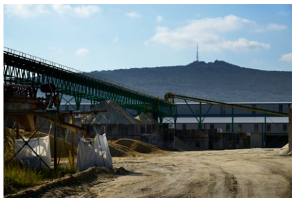
Strzeblowskie Kopalnie Surowców Mineralnych, w tle Ślęza

serpentyt (neolityczna kopalnia odkrywkowa na Jańskiej Górze), magnezyt (Wiry, Sobótka, Kantyna w Chwałkowie), a także chromit (Czernica). Niektóre z tych miejsc są łatwo dostępne i bezpieczne, inne wymagają specjalistycznej wiedzy, sprzętu i umiejętności. By dostrzec jeszcze inne trzeba dobrze wysilić wzrok, by w zbiorowiskach kamieni dostrzec ślad po wiertle bądź rozpoznać fragment kamienia młyńskiego.