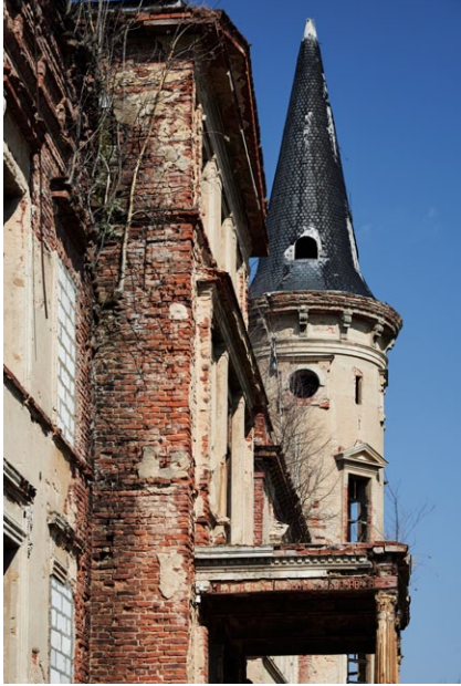
Niszczący pałac w Piotrówku fot. Waldemar Kubiak; 2018

Większość obszaru mezoregionu obejmuje Ślązański Park Krajobrazowy założony w 1988 roku i liczący 15.922 ha (81,9 km 2 ). W jego granicach znajdują się trzy rezerваты przyrody: „Góra Radunia”, „Łąka Sulistrowicka” i „Góra Śląza”. Perłą pierwszego są paprocie serpentynitowe: zanokcica ciemna, zanokcica serpentynitowa, zanokcica klinowata i kończysta. Drugi to raj dla wielbicieli roślinności zielnej. Rosną w nim takie gatunki chronione jak: kosaciec syberyjski, goździk pyszny, lilia złotogłów, pełnik europejski czy storczyki: szerokolistny i plamisty oraz wiele innych ciekawych roślin. Trzecim rezerwatem jest „Góra Śląza”, w którym ochronie podlegają elementy przyrody ożywionej (wiąz górski, lilia złotogłów, czyściec alpejski, krasnorost), nieożywionej (Skalna Perć, Skały Husyckie, Zbójnickie Skały, Wiszące Skały i Olbrzymki), stanowiska archeologiczne oraz zabytki bądź obiekty budowlane (Dom Turysty im. Romana Zmorskiego i Kościół Nawiedzenia NMP).