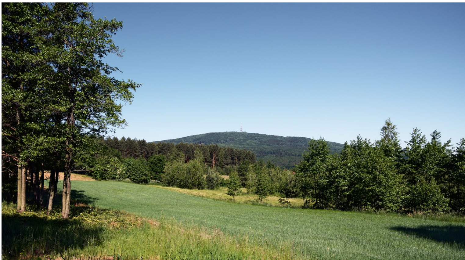
Ślęza — widok z drogi na Przełęcz Stupicką 2015

Sobótka i jej najbliższa okolica stały się popularnym miejscem weekendowych wycieczek. Mimo, że trudno tam w sobotę lub niedzielę odnaleźć ciszę i spokój, w dalszych częściach mezoregionu są one na wyciągnięcie ręki i można się swobodnie rozkoszować przyrodą, zabytkami oraz przygodą.